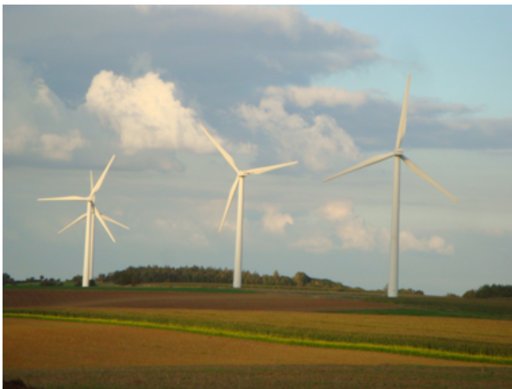
(parc éolien de la haute Lys)